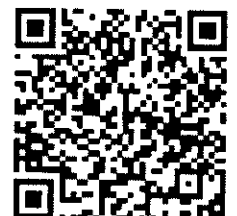
QR-Code ดาวน์โหลด โครงการ ฉบับเต็ม