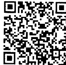
QR-Code ติดต่อ จนท.