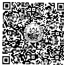
สแกน QR-Code เพื่อสมัครอบรม