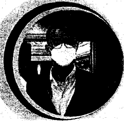
ดร.ศรีรุ่งนง อนันตปุณ วิทยากรผู้ทรงคุณวุฒิ