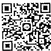
สแกน QR Code เพื่อส่งแบบตอบรับเข้ารับการฝึกอบรม

การสมัครเข้าร่วมการฝึกอบรม ศูนย์นวัตกรรมเพื่อการบริหารวิชาการ มหาวิทยาลัยราชภัฏอุดรธานี โทรศัพท ๐ ๔๒๒๑ ๑๐๔๐ ต่อ ๕๑๔๑, ๐๘ ๐๓๗๖ ๘๖๘๕ ดูรายละเอียดเพิ่มเติมหรือสมัครและดาวน์โหลดเอกสารได้ที่ http://www.Training๑๖๘.com