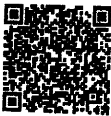
กลับไปชมภาพประชาชน