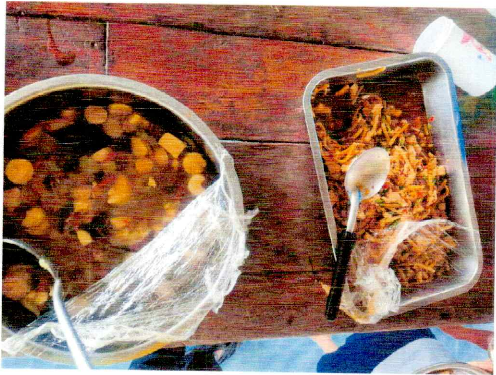
ภาพอาหารกลางวันนักเรียน