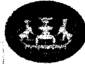
สถาบันคุ้มครอง