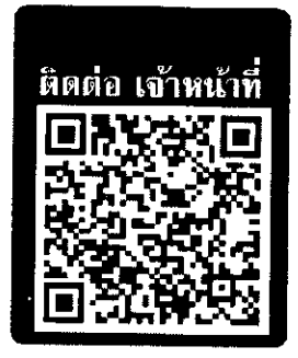
ติดต่อ เจ้าหน้าที่

วันพฤหัสบดี - เสาร์ วันที่ 18 - 20 มกราคม 2567 โรงแรมซีดีบีช รีสอร์ท หัวหิน อ.หัวหิน