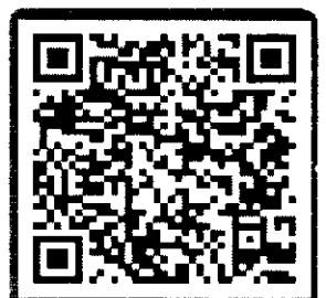
สแกน ดาวน์โหลด โครงการอบรม ฉบับเต็ม