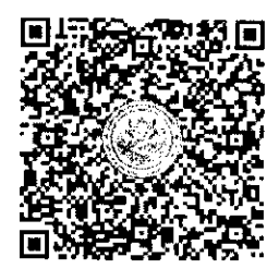
สแกน QR-Code เพื่อสมัครอบรม

วันศุกร์ - อาทิตย์ วันที่ 8 - 10 มีนาคม 2567 โรงแรมเมย์ฟลาวเวอร์ อ.เมือง