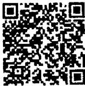
แบบรายงานฯ

กองสิ่งแวดล้อมท้องถิ่น กลุ่มงานเปลี่ยนแปลงสภาพภูมิอากาศ โทร. ๐๒ ๒๕๕ ๘๖๐๐ ต่อ ๒๑๑๒ ไปรษณีย์อิเล็กทรอนิกส์ Saraban@dla.go.th