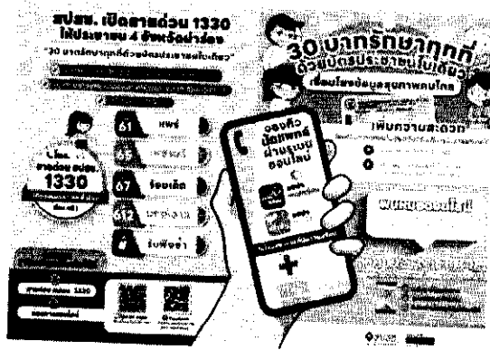
1. แผ่นพับ 30 บาทรักษาทุกที่ด้วยบัตรประชาชนใบเดียว