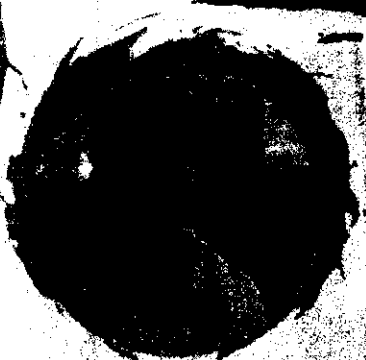
จ.สุรินทร์ แห่งของ ในกรุงเทพฯ

กรุงเทพฯ 7 - 9 ตุลาคม 2565 โรงแรม เอสดี อเวนิว บางพลัด