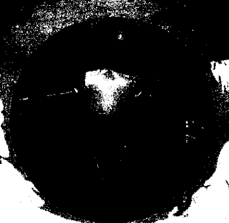
จ.สุรินทร์ แห่งของ ผู้ดำเนินการกลุ่มงานพัฒนา ระบบบัญชีท้องถิ่น