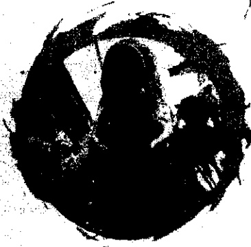
กรุงเทพมหานคร ปทุมธานี ในกรุงเทพฯ

ประจำปีงบประมาณ พ.ศ. 2565 และกรรเจ็ดทำฐานข้อมูลทรัพย์สิน การจัดทำทะเบียนทรัพย์สิน การจัดการรายงาน การระดมทุนทรัพย์สินทางปัญญา (แบบ สปท. สท.1-3) การจำหน่ายทรัพย์สิน การตรวจสอบและกรจัดทำ รายงาน การทำบัญชีเงินและค่าสินทรัพย์ประจำปี ด้วยโปรแกรม Excel อัตโนมัติ และแนวทางการบัญชีบัญชีเพื่อให้ การตรวจสอบตามมาตรฐานการบัญชีภาคธุรกิจ การปรับปรุงบัญชี และการจัดทำงบการเงิน ขององค์กรปกครองส่วนท้องถิ่น ประจำปีงบประมาณ พ.ศ. 2565