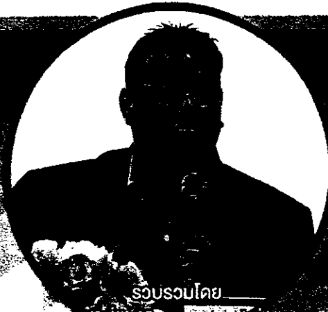
รวบรวมโดย ดร.พิชิต ร้อยทิพย์กลาง รุ่งปิ่น ๐ พิธีเรื่องเล่าจากลมเขียนระเบียบ