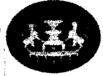
สำนักงานคุ้มครอง