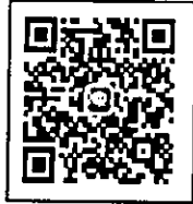
ส่งใบสมัคร