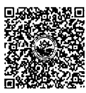
QR-Code ลงทะเบียนอบรม