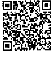
QR-Code ติดต่อ จนท.