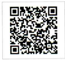
QR-Code ติดต่อเจ้าหน้าที่