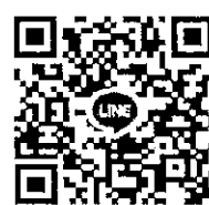
ลงทะเบียนเข้าร่วมประชุม