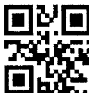
เว็บไซต์ของโครงการ www.mrmapdoh.com