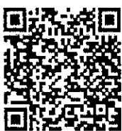
เอกสารประกอบการประชุม

หมายเหตุ : สามารถดาวน์โหลด ข่าวสาร เอกสารต่างๆ และช่องทางการเข้าร่วมประชุมตามคิวอาร์โค้ด