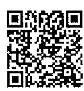
Zoom Meeting ID : 885 6239 3651 Passcode : 91UzYD