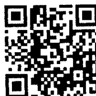
QR CODE กำหนดการ