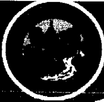
▼ ตรวจสอบประกอบการอาหารสัตว์ ▼