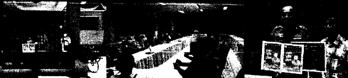
▼ อบรมโครงการควบคุมและป้องกัน มือ เท้า ปาก ในศูนย์พัฒนาเด็กเล็กอบต.ท่าช้าง ▼