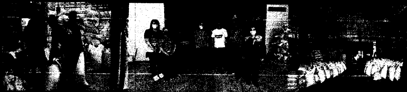
▼ ประชุมสภาองค์การบริหารส่วนตำบลท่าช้าง สมัยสามัญสมัยที่ 3 ครั้งที่ 2/2566 ▼