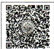
QR-Code สมัครอบรม

ผู้อำนวยการสำนักงานบริการวิชาการ ปฏิบัติกรแทนอธิการบดีมหาวิทยาลัยศิลปากร