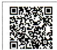
QR-Code ติดต่อเจ้าหน้าที่

สำนักงานบริการวิชาการ มหาวิทยาลัยศิลปากร (ตลิ่งชัน)