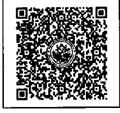
QR-Code เจ้าหน้าที่ QR-Code ลงทะเบียนอบรม