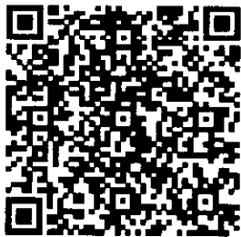
QR Code ๑ ยืนยันการเข้าร่วมประชุม