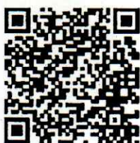
ส่งใบสมัคร