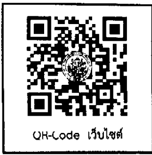
QR-Code เว็บไซต์

ชื่อบัญชี : มหาวิทยาลัยศิลปากร เลขที่บัญชี : ๙๘๒-๓-๐๙๗๘๑-๒