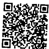
QR Code Line