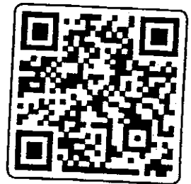
สมัครออนไลน์