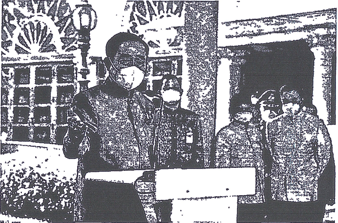
พล.อ.ประยุทธ์ จันทร์โอชา

นายกรัฐมนตรี ไม่รู้จะตอบยังไง ชาวบ้านร้องปัญหาน้ำท่วมผ่านสื่อ แนะนำแจ้งในพื้นที่-ศูนย์ดำรงธรรม