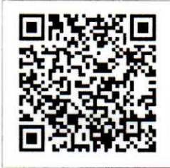
QR-Code เจ้าหน้าที

จึงเรียนมาเพื่อโปรดพิจารณาเข้าร่วมการฝึกอบรมและประชาสัมพันธ์หลักสูตรต่อไป จักขอบคุณยิ่ง