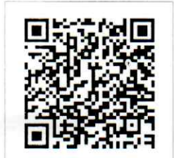
QR-Code ดาวน์โหลด โครงการ ฉบับเต็ม

ผู้อำนวยการสำนักงานบริการวิชาการ ปฏิบัติการแทนอธิการบดีมหาวิทยาลัยศิลปากร