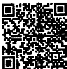
QR Code แนวทางการบูรณาการกิจกรรมฯ และแบบรายงาน ๑ - ๓

สำนักงานส่งเสริมการปกครองท้องถิ่นจังหวัด กลุ่มงานบริการสาธารณะท้องถิ่นและประสานงานท้องถิ่นอำเภอ โทร./โทรสาร ๐ ๓๒๔๒ ๔๕๑๘ - ๙