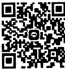
QR Code กลุ่มไลน์ การศึกษา อบท.เพชรบุรี