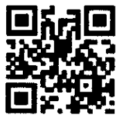
QR Code สมัครอบรม

สอบถามเพิ่มเติมได้ที่ โทรศัพท์ : 032-709400 ต่อ 228 โทรสาร : 032-709445 facebook : สำนักงานศาลปกครองเพชรบุรี