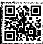
QR Code กำหนดการอบรม