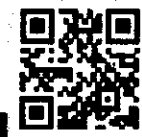
QR Code ลงทะเบียนอบรม ผ่านระบบ Cisco Webex