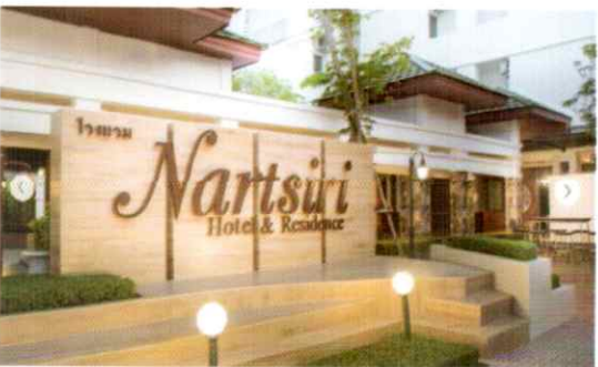
โรงแรมนาถสิริ อุบลราชธานี