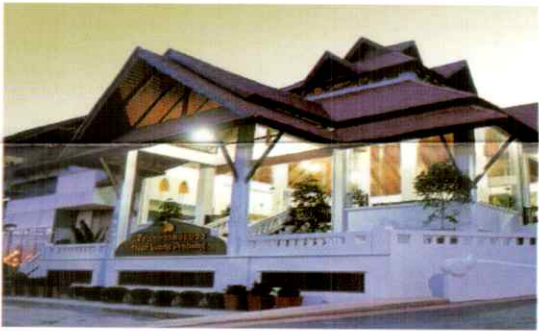
โรงแรมบีพี เชียงใหม่ ซิดี เชียงใหม่