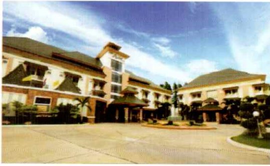
โรงแรมสบายไฮเทล นครราชสีมา