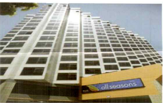
โรงแรม The Seasons Hotels พัทธยา