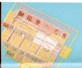
โมเดลสถาปัตยกรรม