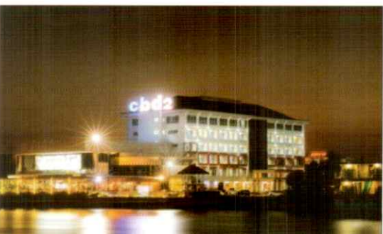
โรงแรม CDB2 สุราษฎร์ธานี