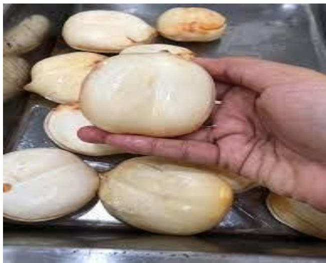
ทำน้ำตาลโตนด