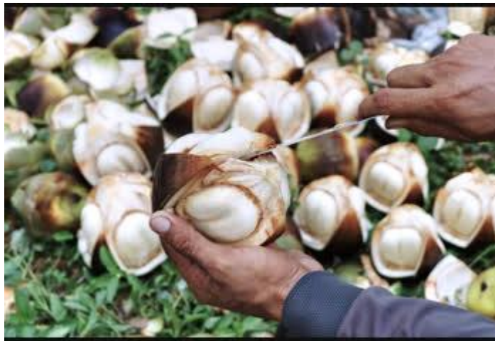
ทำน้ำตาลโตนด